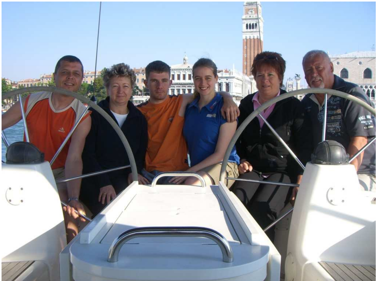
Unsere Crew vor dem Marcusplatz in Venedig

Törn: Izola – Umag – Rovinj – Venedig – Lovrečica – Izola